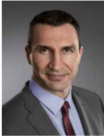
Dr. Wladimir Klitschko

Ordinarius Universität St. Gallen Führung von Hochleistungsteams